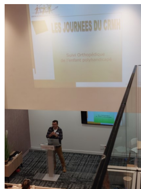
URPS (Paris 16)

Évaluation de la journée par le biais d'un questionnaire et délivrance d'une attestation de fin de formation